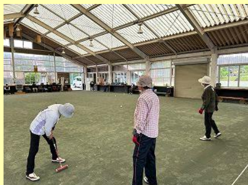
5月16日(木) ゲートボール大会の様子