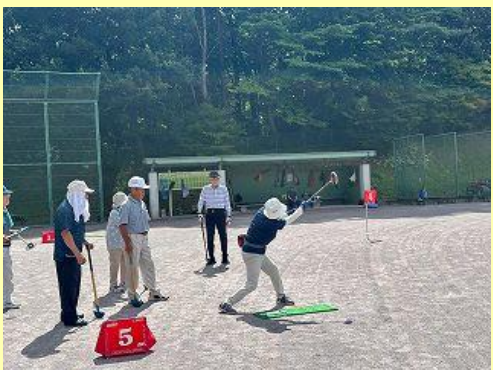
7月30日(火) グラウンドゴルフ大会の様子