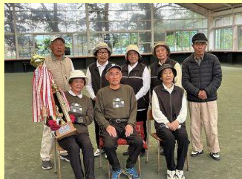
優勝 きさらぎ 準優勝 新田 3位 原A 4位 本宿