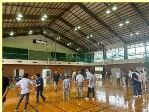
8月27日(火) 輪毬大会の様子